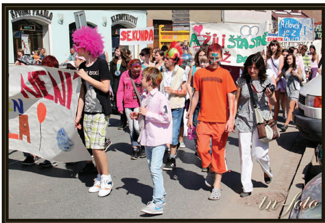
autor: Tomáš Navrátil